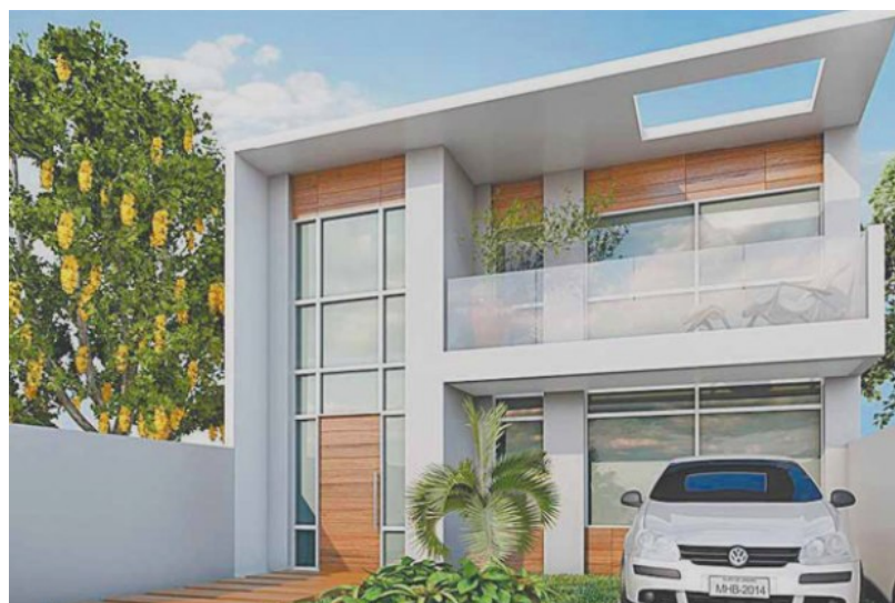
Sugestão de casa do Holiday, da Zayd, em Maricá, município da Região Metropolitana