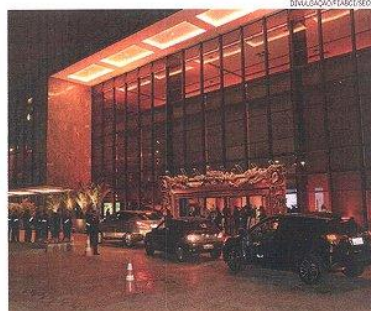
Tradição. Clube Monte Líbano sedia o evento de premiação

A Carvalho Hosken S/A ganhou prêmio de "visão e ousadia na viabilização do Centro Metropolitano da Barra", no Rio. Em área de 4 milhões de m², a empresa implanta um bairro planejado que já conta com